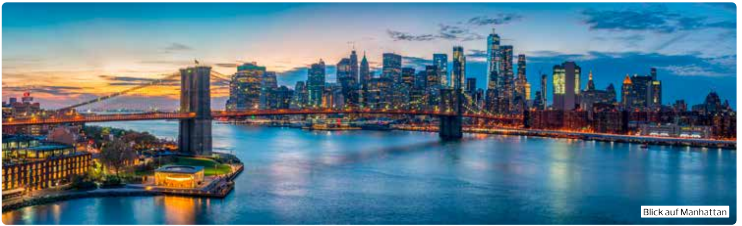
Blick auf Manhattan

vor ( https://www.auswaertiges-amt.de/de/ReiseUndSicherheit ). Gegebenenfalls gelten abweichende Einreisebedingungen für nicht-deutsche Staatsbürger.