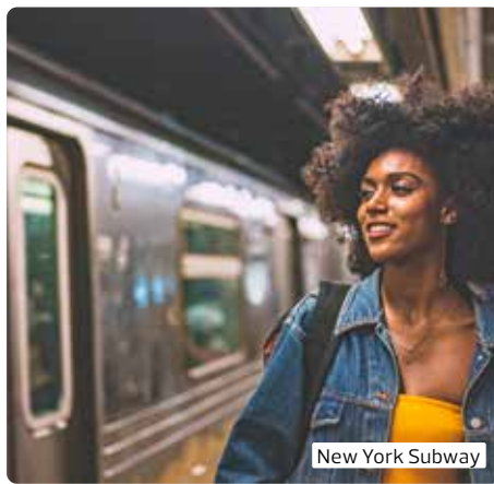
New York Subway