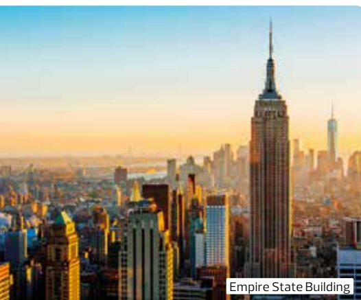
Empire State Building