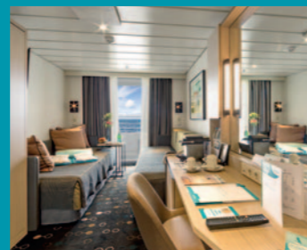
2-Bett, Superior, Balkon, Orion-Deck (Kat. P, PG)