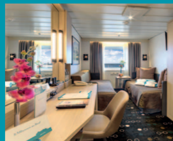
2-Bett, Saturn-/Orion-Deck (Kat. I, K, L, M)