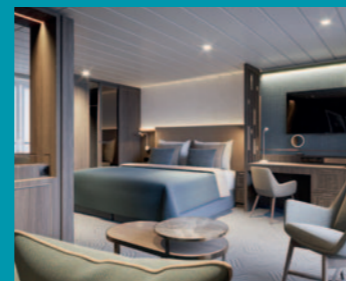
2-Bett-Suite, Balkon, Lido-Deck (Kat. V)